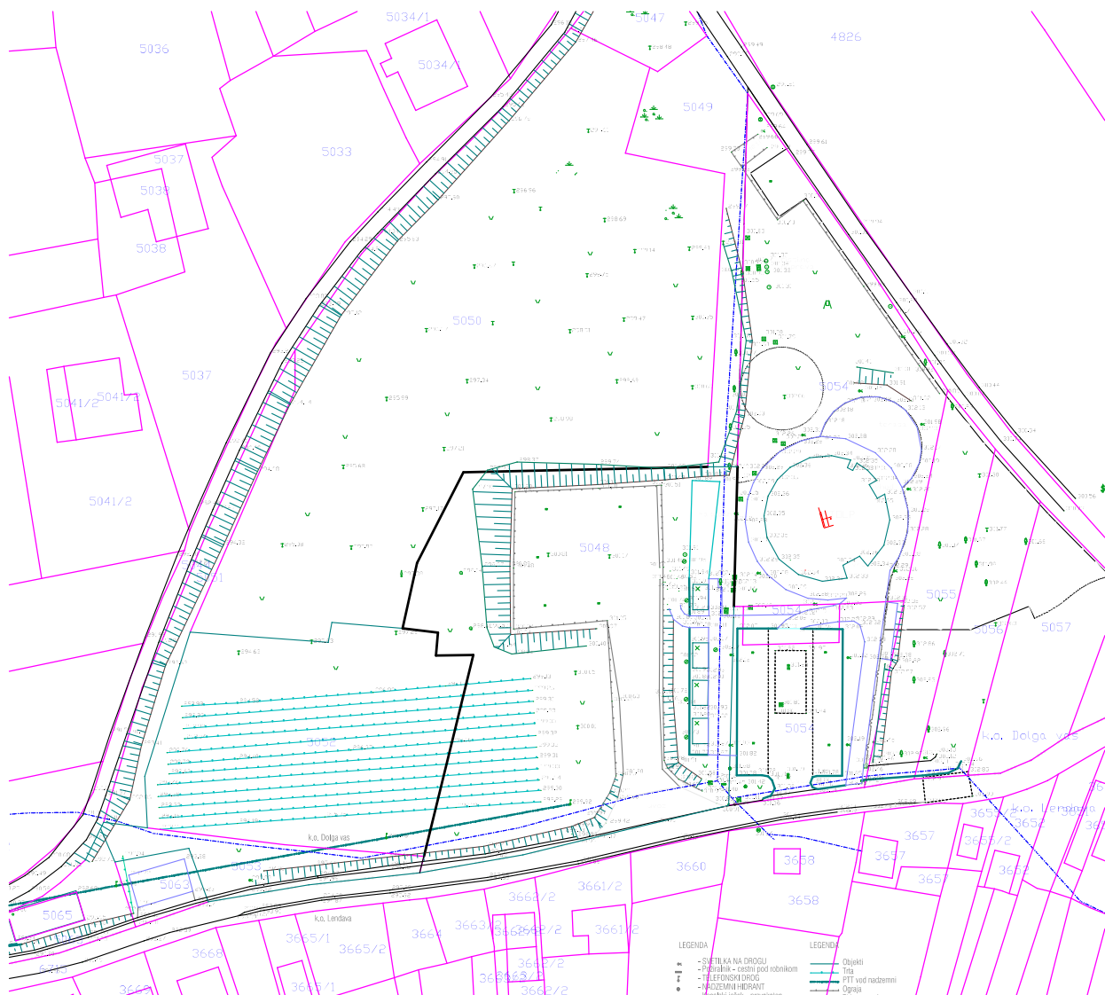
Slika: Obstoječe stanje

Z idejnim projektom je bilo predvideno, da bo objekt dostopen s parkirišča za osebna vozila, lociranem na parceli št. 5048 in bi se hkrati s peš potjo navezoval na razgledni stolp Vinarium.